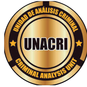
Unidad de Análisis Criminal | Colombia