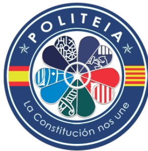
Asociación de policías de Cataluña | España