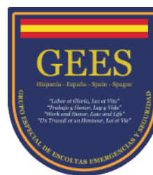
GEES Grupo Especial de Escoltas, Emergencias y Seguridad. | España