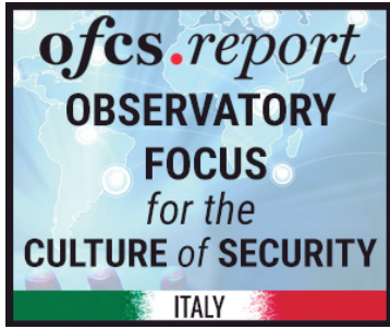
Observatory Focus for the Culture of Security | Italia